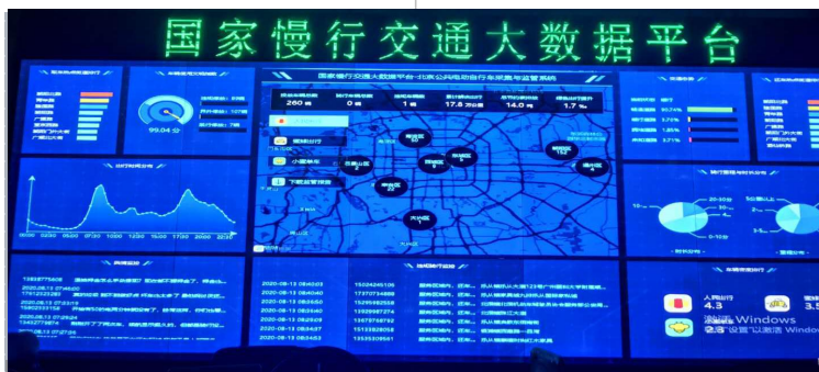
政府领导管控的国家队