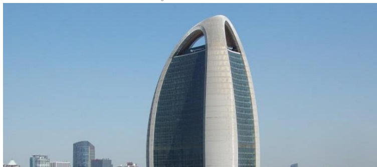
党媒人民日报背书