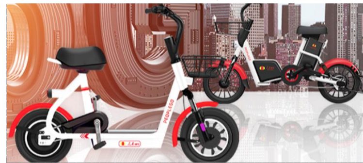
最大的慢行交通出行平台